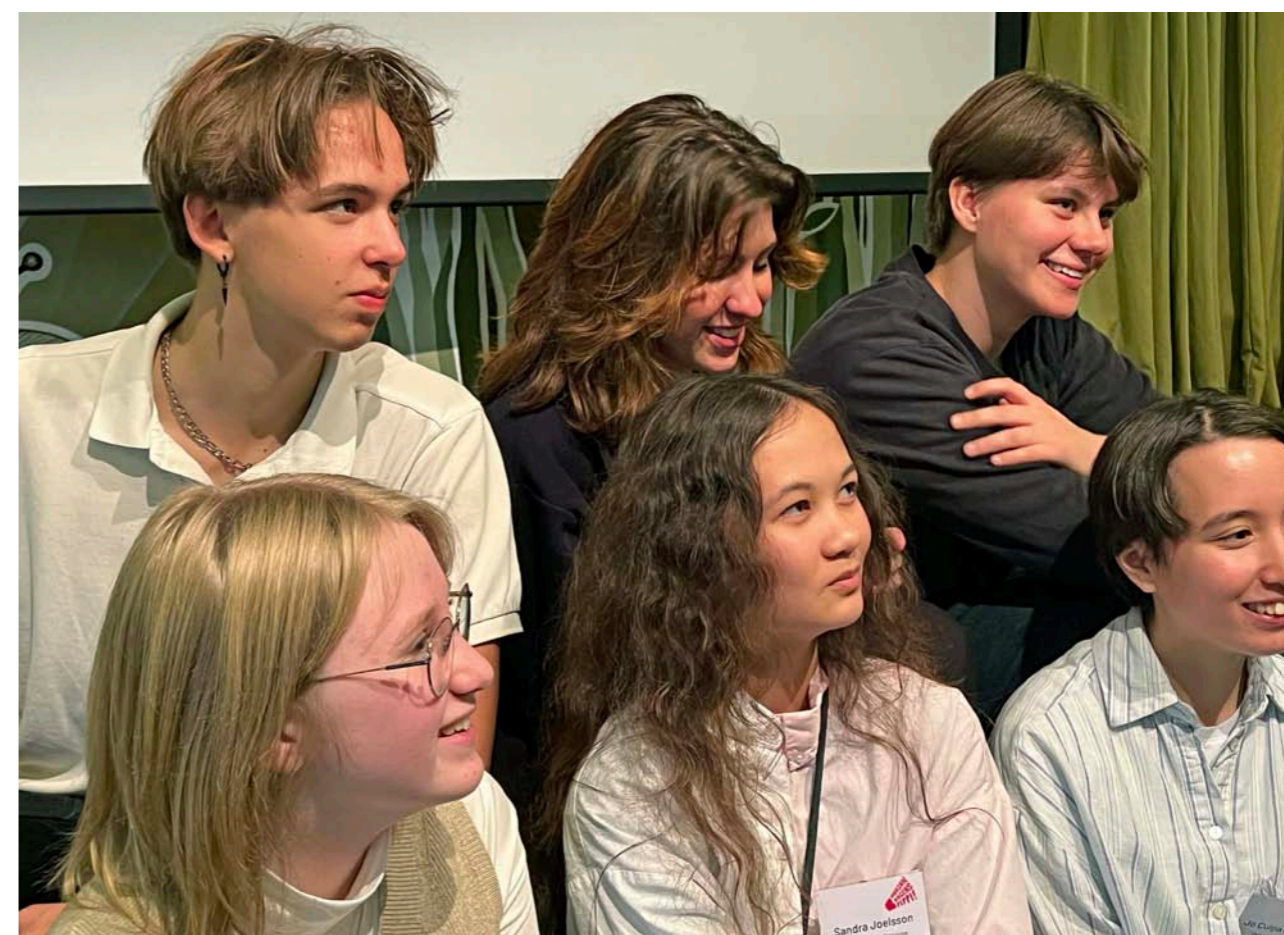
Unga från Skrivsommars medverkar på Morgondagens Pippi 2024.